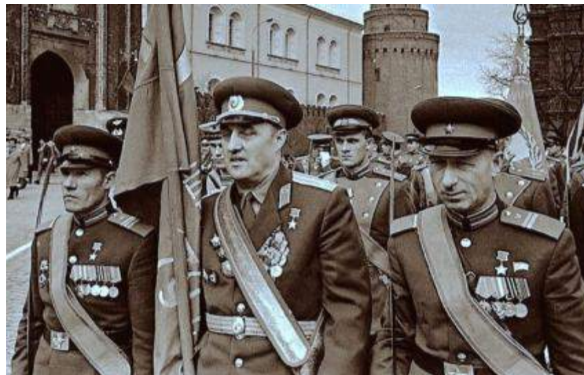
Егоров и М. Кантария на Красной площади под Знаменем победы. Двадцать лет спустя. 9 мая 1965 года

Тогда же был проведен Второй парад Победы.